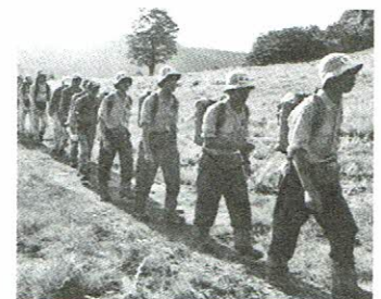
行動中の選手たち