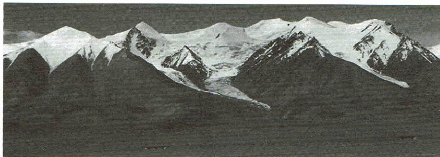
シータータンから玉珠山塊を望む

場所 中国 青海省格尔木市(ゴルムド市)東崑崙山脈 ☆ 玉珠峰の西側にある無名峰(未踏峰) 5,828m ※トレッキング隊の日程内容は「新山協ニュース」12月号(第291号)でご確認下さい。