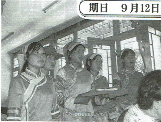
西寧市近郷 土族の娘たち