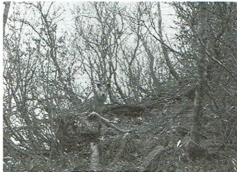
蒜場山のカモシカ(中央)

協会の本年度の親睦登山が、新発田市赤谷地区の蒜場山で10月30日(日)に大勢の参加を得て行われた。