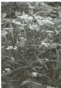
▶母種 ヒヨドリバナ 沙流川 8月15日