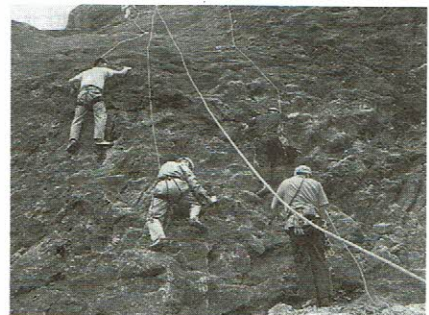
岩登り講習会風景