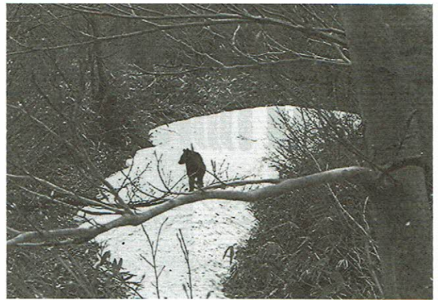
桑代山のクマ

う気持ちでした。そして、山は彼らの生活の場でもあるので人間が邪魔をするべきではないと思います。熊でも、マ