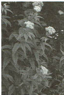
▶ヨツバヒヨドリ 三国山 7月24日

本県の山地帯始め本州や北海道に産し、草状1m内外。ほとんど枝分かれせず花は通常淡紅色。葉は3~4枚輪生する(V, sachalinense~サハリンに生きる)。母種はヒヨドリバナ(chinense~支那に生きる)で全国山野に分布し、草丈1~2m、さかんに枝分かれして花は通常白。ヒヨドリとは鶉で花が鶉の胸の毛に似る故の説や鶉の鳴く頃に咲く説がある。