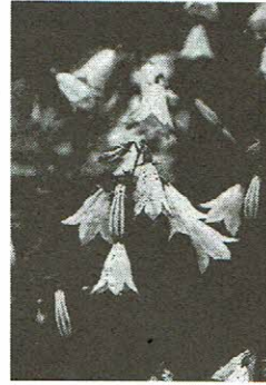
▶母種 ヒメシャジン 飯豊連峰 8月7日