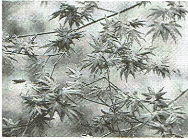
ヤマモミジ 浅草岳 5月20日

本州の日本海側の山に産する雪国変種。変種名 V. matsumurae (マツムラ)。本県には数多く産し、紅葉すると一本の木でも紅や黄、はては緑のままなど良く変化する。母種は太平洋側のイロハモミジ palmatum (手のひら状の) で葉は細く裂けて先は鋭く尖るのに対して細く裂けない、また果は、ほぼ水平に開くのに対して「ハの字型」に開き樹形も背は低く横へ広がる雪国型。属名は針状で楓は蛙手の約。