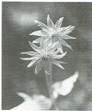
▶ハートリーフ・アルニカ 7月12日

高山帯にごく一般に見られる種で、母種は北海道のエゾウサギギク (unalascensis kara ~ウナラスカ島の) で花の中心にある筒状花の中は無毛に対して本種は有毛。姿、形はほとんど同形。変種名 (Tschonoskyi ~トシノスケ)。カナディアンロッキーの草原には良く似た花が一面に咲きハートリーフ・アルニカと云う。属学名はアルニカでアルニカチンキ (薬草) よりの名。カナダではアーニカと発音している。