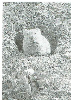
ベースキャンプ付近の愛嬌者 ナキウサギ

〒940-2033 長岡市上除町甲1762-1 Tel&FAX 0258-46-6448