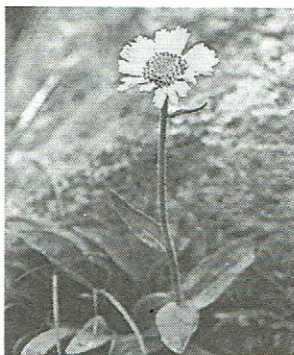
▶母種 エゾウサギギク 平山 7月16日