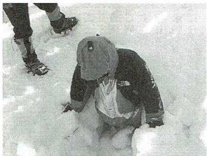
雪崩埋没の体験をする参加者