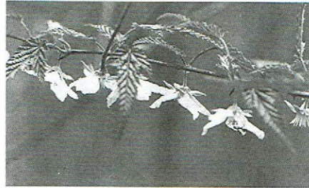
母種 ナガバモミジイチゴ 剣山 5月2日

中部～東北の低山帯に産し県内いたるところに見られる。白い花は枝に並んで下向きに咲き、棘はかなり多く葉はモミジの葉によく似る。母種は西日本のナガバモミジイチゴで切れ込んだ葉の中央は長々と伸びる。種名 palmatus は「掌状の」の意で葉の形が大きく異なる。属名 Rubus は「赤くなる」の意でこの種の実は最初黄色くなるが後に赤くなり食べられる。