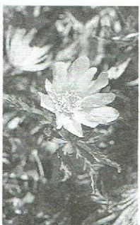
4月 (キクザキイチリンソウ)