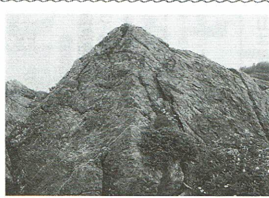
梅海新道高位起点、県下最古の飛騨外縁帯変成岩

このためとは申し上げられませんが、本会の目的・事業に賛同する方々を個人・団体を問わず、賛助会員とする事が出来ることとなっております。平成17年度に入り、当協会の活動発展を容易とするため、賛助会員を募集する事に致しました。各位におかれましては、ご理解と趣旨ご賛同の上、多数のご入会をお願い申し上げます。