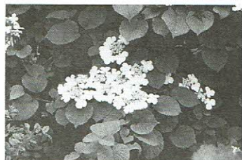
ケナシヤブデマリ 五頭山(5月18日)