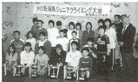
選手達と役員で記念撮影

は毎日の練習でそれらを意識した練習メニューをくむこと、休日に行えるだけ多くのルート課題を、こなすということが重要になります。勿論休日のクライミングの為にモチベーション