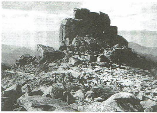
奥秩父最高峰、金峰山(2,538m)の五文岩花崗岩