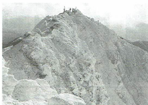
八ヶ岳火山の最高峰、元旦の赤岳(2,899m)

●A5版／262ページ ◎定価(本体1,600円+税) 2005年4月下旬発売 尚、高山植物の著書も多く、新聞や本誌の「カムチャッカの高山植物」でもおなじみの加藤明文氏の『新潟県の山の花』も好評だ。写真の美しさには定評があり、ポケットサイズで携帯用に便利。併せて購読お願いします。 ●ポケット版・250頁 定価(本体1,500円+税) 会報編集委員会