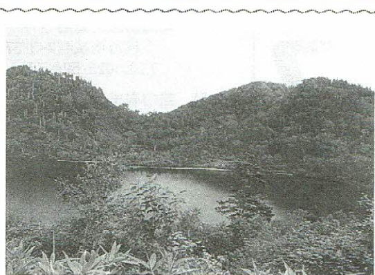
風吹大池三山の風吹岳(右)・横前倉山・岩菅山