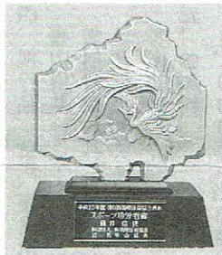
スポーツ功労者賞トロフィー