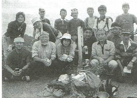
山頂での記念撮影

選定することが重要。 ②一ヘクタールの森林の保水量は二〇〇リットル入りドラム缶一万本。ダムは貯水力はあるが、保水力がなく、環境への負荷が大きい。 ③森林が山地災害を防止する