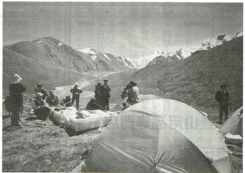
BCより天山山脈を眺む

7月31日(月) 物心両面にご支援ご協力を賜り心から御礼申し上げます。詳細については、報告書で報告致します。ありがとうございました。