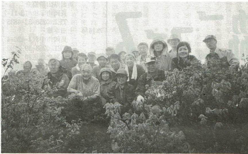
小雨降る立烏帽子の山頂で

5月21日9時、大石ダム駐 車場に集合。参加者は、遠くは青海町より、 今年度の婦人部親睦登山の 35名でした。