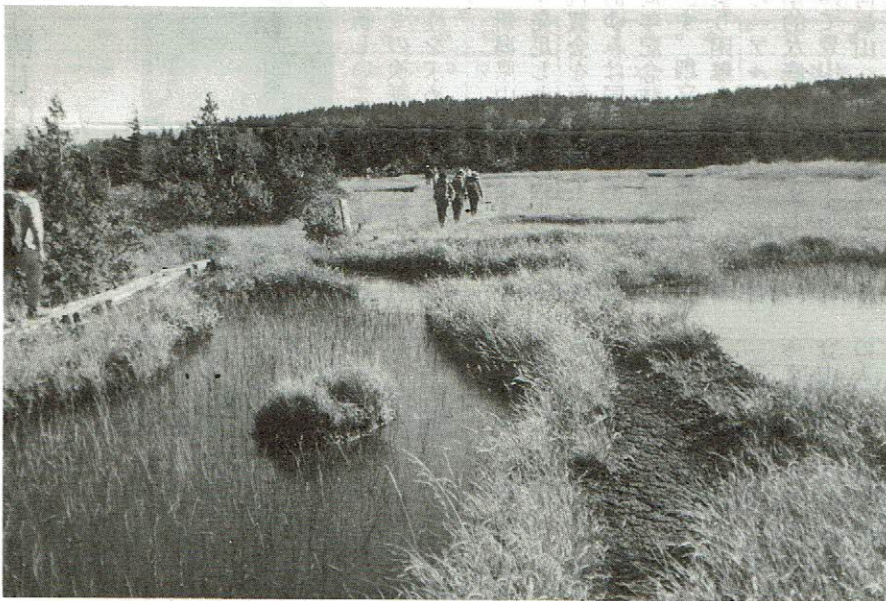
薄氷の張った池塘の脇を小屋へ向う

実施されました。 第1日目の23日は座学でした。会場は津南町の大割野区民会館という所で、以前は農協の事務所であったので鉄筋コンクリート3階建の立派な建物です。これが、今晚の寝