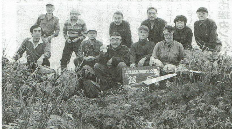
ガスの中での乾杯 ウサギはどこにいったかな

新年会に先立ち同会場にて、 理事会を開催します。 役員、理事、委員各位は10 時までに参加願います。