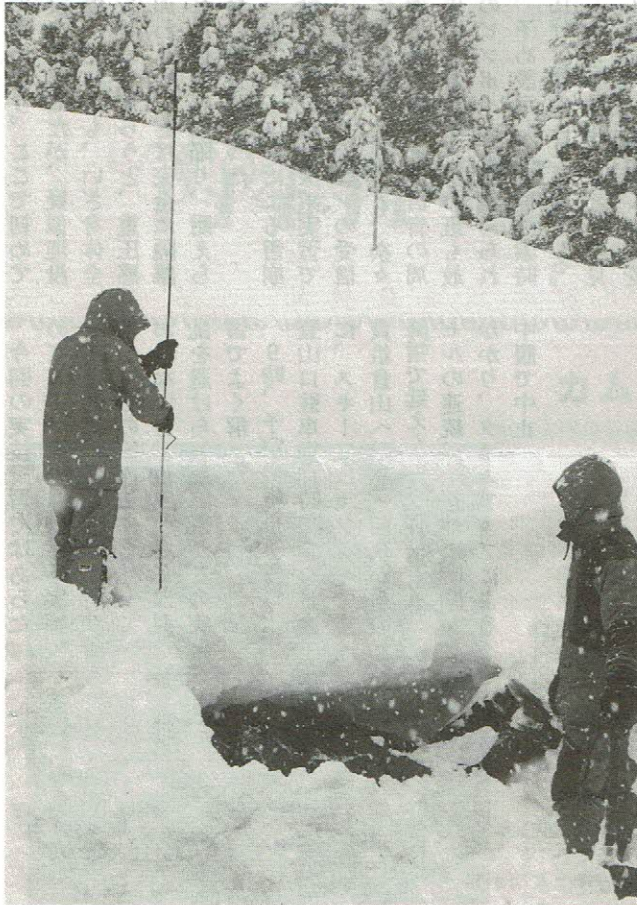
ゾンデ棒での埋没者捜索訓練

雪崩事故に遭わないためにも、必要な知識を頭に入れ身体が覚えるまでの時間を惜しんではならない。登山者が遭難する雪崩の9割以上は面発生表層雪崩であると言われている。面発生表層雪崩は積雪内に弱い層(弱層)があるとき、その層の上に積もった雪(上載積雪)の荷重が雪崩を引き起こす力(駆動力)となる。弱層の強度(抵抗力)が駆動力より十分に大きければ雪崩は発生し