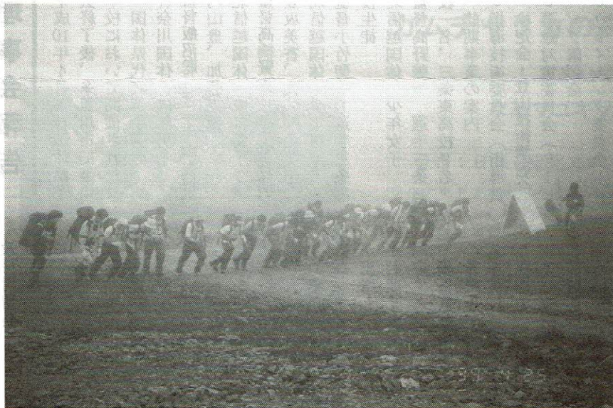
雨の中スタートする少年男子

少年女子 1位 三条東高校D 2位 三条東高校E 総合成績 成年男子 1位 岩広山岳会